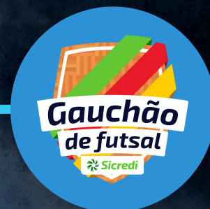
GAUCHÃO DE FUTSAL DE BASE